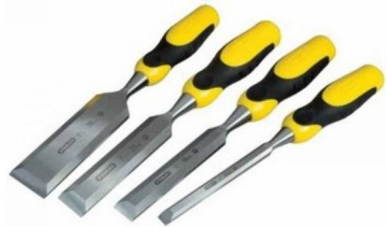
Рис 1 Стамески

инструменты, шириной 25-35 мм. Носить стамеску можно у пояса в футляре из плотной материи или в полевой сумке. Чтобы случайно не оставить копалку на месте сбора, в рукоятку можно продеть шнур и привязать ее к поясу.